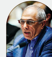
رضا حسینی رئیس وقت خانه صنعت و معدن و تجارت خراسان رضوی