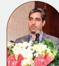
علی رسولیان معاون وقت اقتصادی استاندار خراسان رضوی