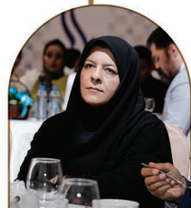
مهندس میرشاهی معاون محترم وقت فرماندار مشهد مقدس